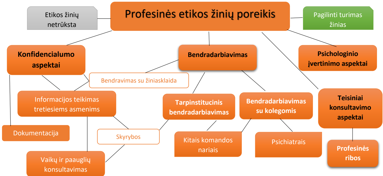
2 pav. Temos, kuriomis apklaustieji psichologai norėtų pagilinti profesinės etikos žinias

paminėti 9 kartus, kai kurie atsakiusieji psichologai įvardija teisinių ir etinių žinių persidengimą bei nepakankamą profesinių ribų suvokimą.